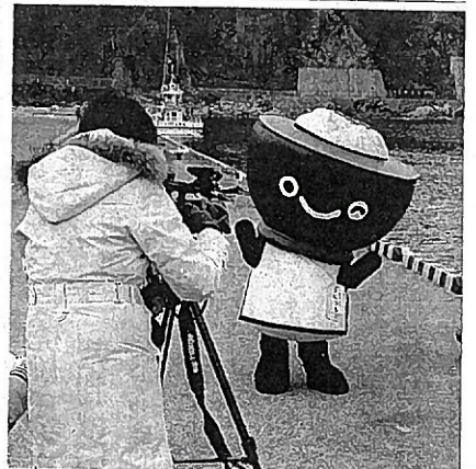
海女の素潜り漁の舞台を紹介するテレビ局の Reporter。中央は Rキャラクター「うっち」